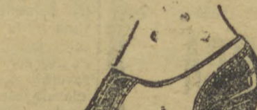
8117 — Typo esporte, to resistente, todo em naco marron, proprio para uso diario, salto de sola 3 centi- metros. Temos este typo em calçado real "POCRA"