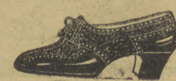
Referencia 111, modelo Na- politano — PARA O INVI- NO, torção e salto mexicano, 3 e 4 centímetros, de 32 a 40. Em superior naco cor de vinho, marron, rosa beje 23$

Especialista em calçados finos e duraveis