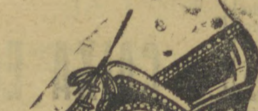
10040 — Modelo em branco e marron, gaspia toda picó- tada em naco marron e bran- co, salto 2 centímetros.

Calçado sob medida Vendas só a dinheiro Avenida Vicente Machado 64