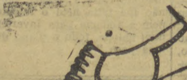
6030 — Modelo em salto mexicano, 3 centímetros, em naco beje e ..... gaspia, toda trancada