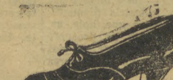
Referencia em calçado Luis XV, modelo napolitano, para inverno, salto 4, 5 e 5 1/2c. Em superior pelica enverniz- ada preta ou boscal preto ou cor de vinho, de 32 a 40 ..... 3$