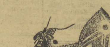
10038 — Interessante mo- delo em naco beje e azul, sal- to mexicano 3 cc. Temos es- te modelo em salto de sola 1 centímetros.