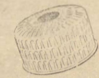
PÓ DE ARROZ

De finura impalpável e aderindo tão perfeitamente que se confunde com a cor natural da pele, o Pó de Arroz Coty contém ainda o arebador perfume L'aimant — que as mulheres adoram e os homens não esquecem. Experimente-o. E sinta — a Sra. mesma — a aura de encanto do Pó de Arroz L'aimant.