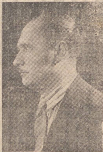
Poeta Cleto de Moraes

Cleto de Moraes é um poeta consagrado nas letras nacionais. Autor de diversos trabalhos de real mérito, tem sido favoravelmente elogiado pela critica, que o coloca entre as grandes figuras intelectuais do país.