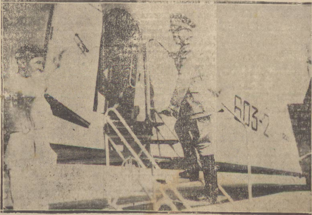
O Conde Ciano, Ministro do Exterior da Italia, embarca n um avião que voará a Berlim.

Castellões distribuirá para as Festas de Fim de Ano, além de uma avultada quantidade de cheques, uma GELADEIRA, COM OS CIGARROS CINE. CINE é um cigarro fraco e suave para 600 réis a carteira. CINE é um produto da CASTELLÕES.