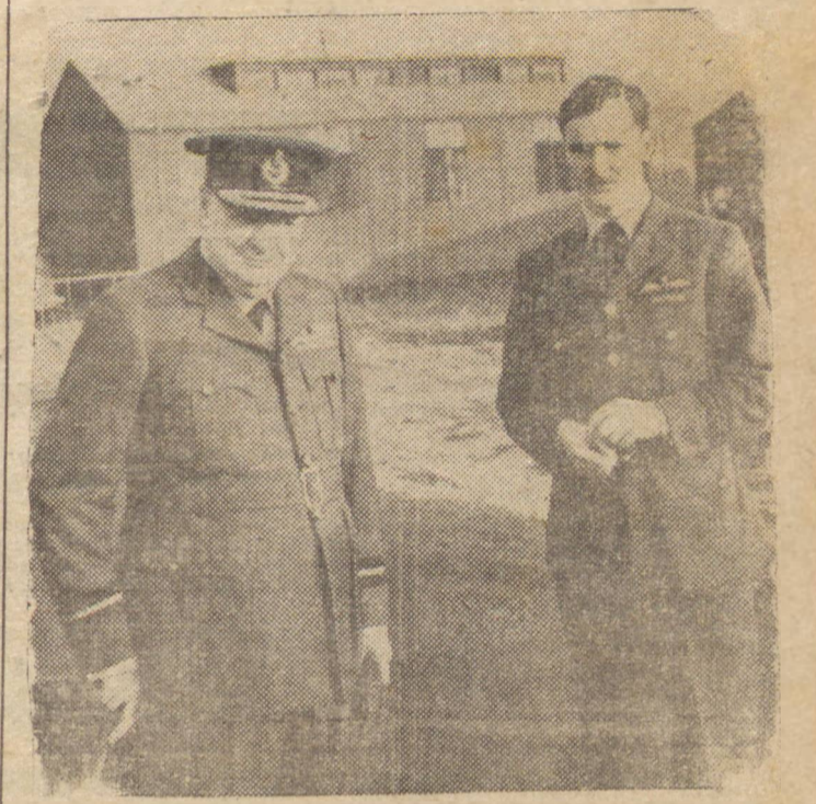
WINSTON CHURCHILL NO SEU UNIFORME DE BRIGADEIRO DO AR

SINGAPURA, 29 (U. P.) — O quartel general britânico comunicou que as forças inglesas estabeleceram contacto com o inimigo em frente de Perak, ao sul de Ipoh. Outras regiões malasianas, na mesma situação, não sofreram nenhuma modificação. A queda da cidade de Kuching e a sua ocupação pelos japoneses foi confirmada. Comunicou tambem que os aviões de bombardeio da RAF levaram a efeito durante a noite de ontem um novo ataque contra o aerodromo de Sungai e Patani, causando incendios e explosões. Na costa oriental aviões inimigos bombardearam e metelharam os nossos posições em Kuantan sem causar danos e vítimas. A aviação japonesa atacou tambem durante o domingo a cidade de Medan e o porto de Swatoham, ocasionando ligeiros danos. Na manhã de hoje foi bombardeado o aerodromo de Kuala Lumpur.