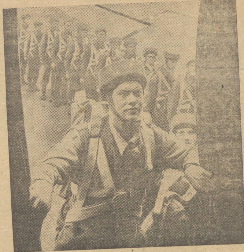
Paraquedistas noruegueses encaminham-se para os aviões de transporte, afim de entrarem em ação