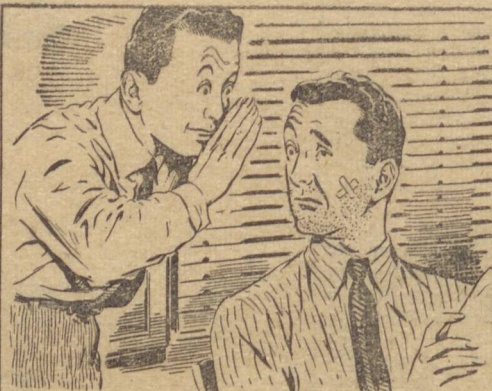
— Por que não fazes como eu? Uso a Gillette, para não perder tempo. Economizo e chego sempre na hora.

POR que esperar que chegue sua vez, se, a qualquer hora, Gillette está em condições de bem servir? Não perca tempo! Faça a barba em casa, diariamente, para estar sempre em boa forma. Nunca terá sustos com o relógio, e cumprirá, com pontualidade, deveres de trabalho e compromissos sociais. Quando se usa Gillette, fazer a barba é tão fácil que constitui um verdadeiro prazer. Adquirir, hoje mesmo, um aparelho Gillette e zelar pelo esmero de sua aparência, poupando tempo e fazendo economia real com as legítimas lâminas Gillette Azul.