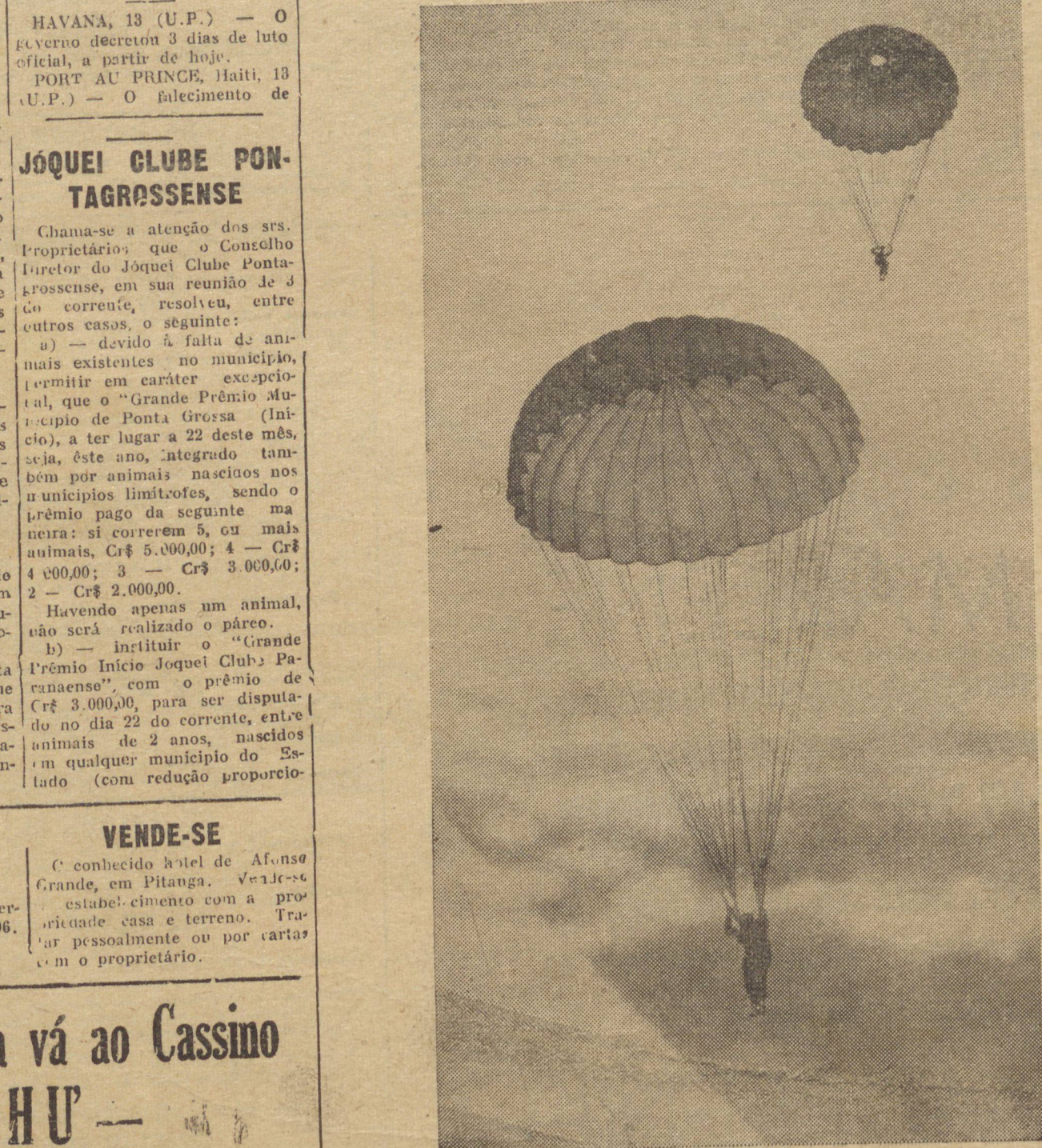
Paraquedistas no rueguêses em treino na Grã Bretanha