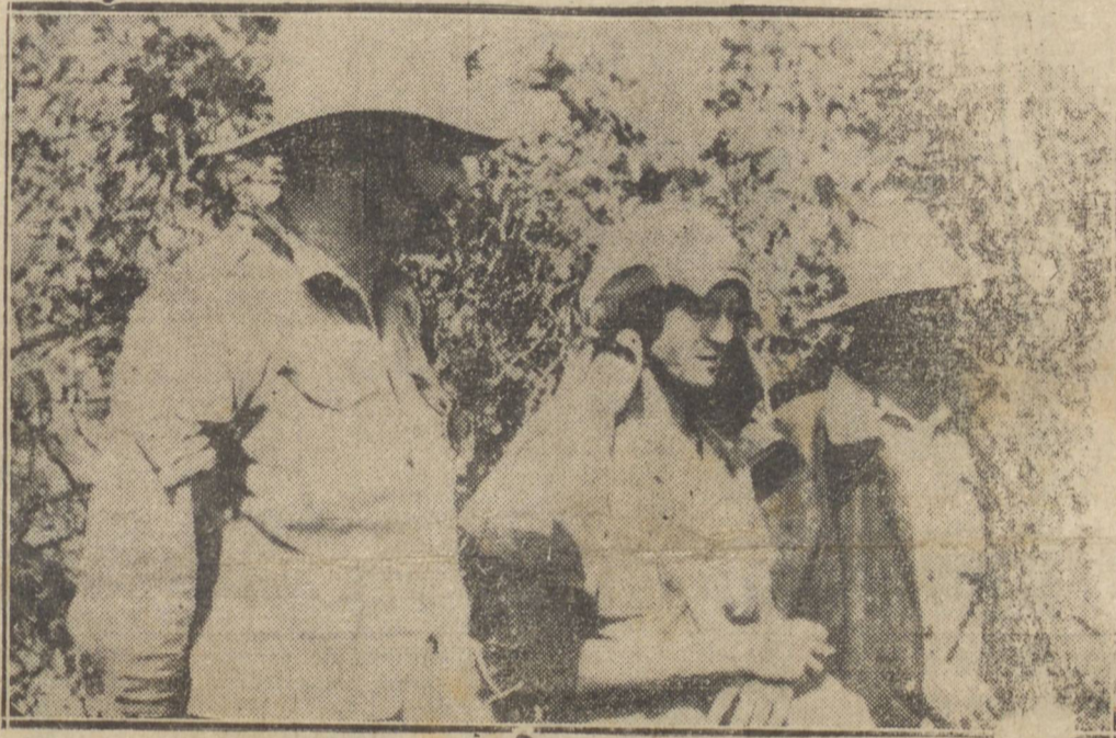
EXPEDICIONARIOS ITALIANOS NA ALBANIA