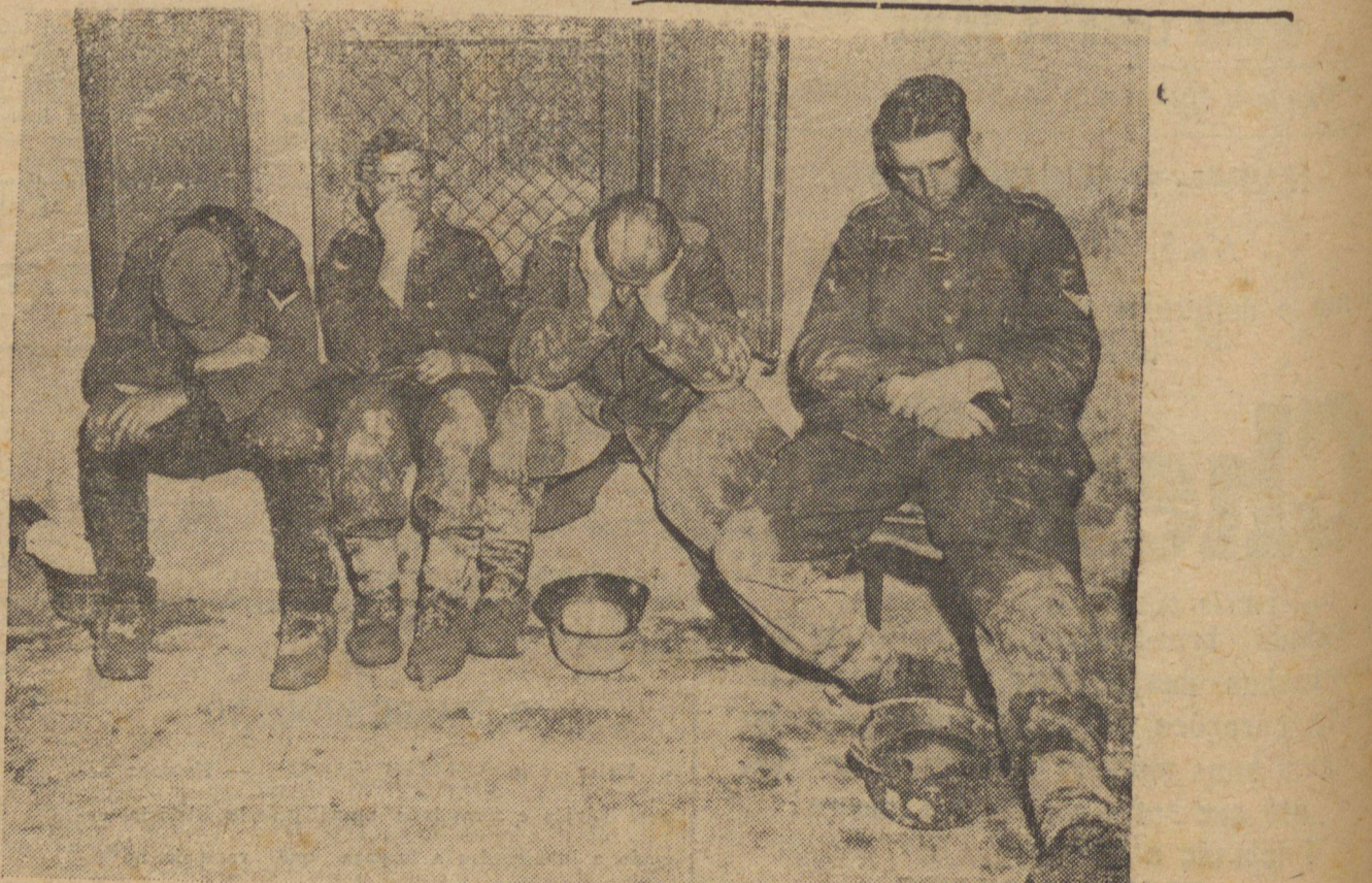
Sugestionados pela sua propria propaganda os nazistas sonharam um dia com o dominio do mundo. Agora os malfadados alemães veem que foram iludidos. Esses nazistas capturados pelo Quinto Exército americano na Italia só sonham com a paz que existe nos campos de Concentração.