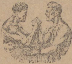
Tomar VANADIOL, o fortificante que fortifica

Porque necessitam Depressão nervosa, insônia, fraqueza, melancolia, cansaço, desânimo e mau estômago VANADIOL contém elementos de ação rápida e eficaz nos casos de fraqueza e neurasthenias, sendo sua fórmula conhecida pela Saúde Pública e conhecida dos medicos mais famosos.