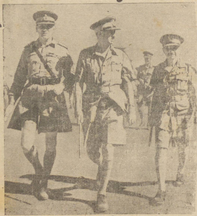
O GENERAL WAVEL E OFICIAIS DE SEU E. M.

BATAVIA, 14 (U. P.) — As forças nipônicas conseguiram posições junto ás defesas externas dos aliados nas Indias Orientais holandesas e os defensores prepararam-se para enfrentar a todo momento um novo ataque japonês.