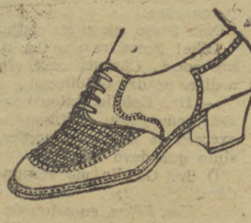
6030 — Modelo em salto mexicano, 3 centimetros, em naco beje e marron, gaspia toda trançadinha.