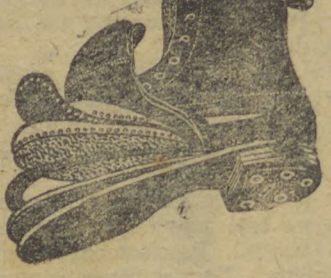
inverno e á prova d'agua, sola dupla e salto prateleira — Preço especial ..... 45$