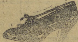
Referencia ex. calçado Luiz XV, modelo napolitano, para inverno, salto 4, 5 e 5 1/2. Em superior pelica envernizada preta ou boscal preto ou cor de vinho, de 32 a 40 ..... 3$