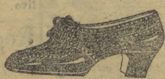
Referencia 177, modelo Napolitano — PARA O INVERNO, forma e salto mexicano, 3 e 4 centimetros de 32 a 40. Em superior naco cor de vinho, marron, rosa beje 26$