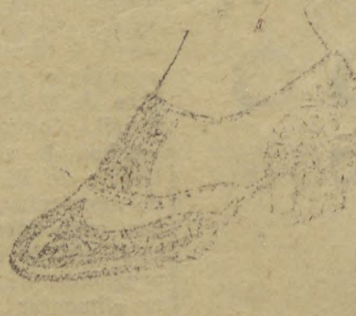
8117 — Typo esporte, muito resistente, todo em naco marron, proprio para uso diario, salto de sola 3 centimetros. Temos este typo em calçado boscal "ROCHA"