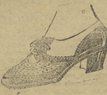
10038 — Interessante modelo em naco beje e azul, salto mexicano 3 cc. Temos este modelo em salto de sola 3 centimetros.