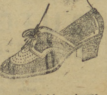
10040 — Modelo em branco e marron, gaspia toda picotada em naco marron e branco, salto 3 centimetros.