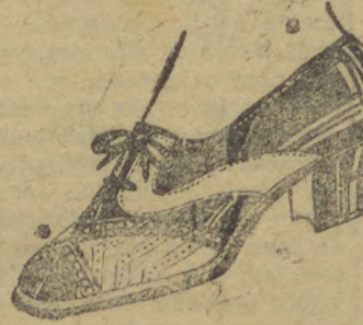
10035 — Extra phantasia em naco marron e Havana salto mexicano 3 centimetros.