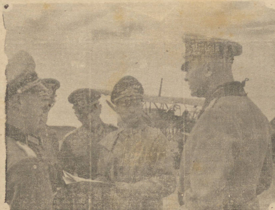
Avião de reconhecimento alemão pronto para uma incursão e partir, são estudados os planos.