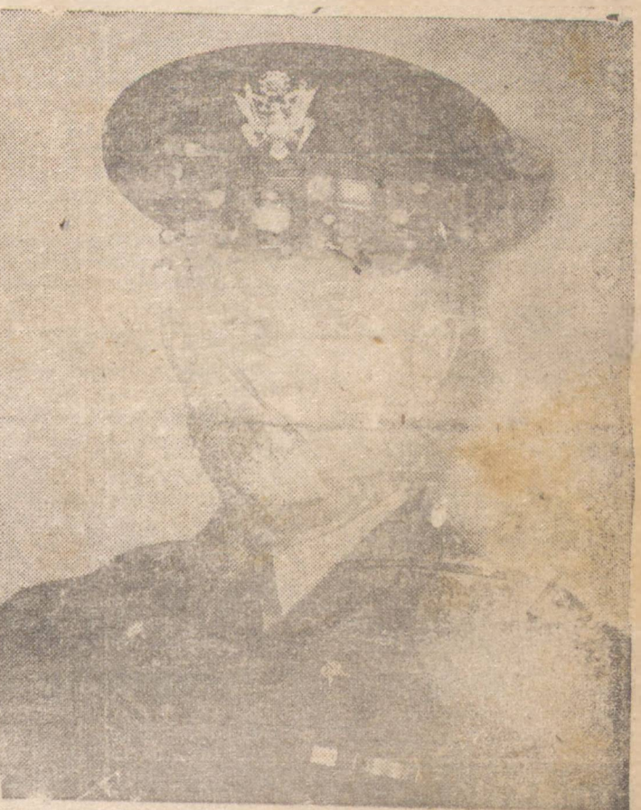
GENERAL DWIGHT EISENHOWER , comandante-em-chefe das forças aliadas na Africa do Norte.

das tropas do general Anderson e encontraram por toda a parte numerosos veículos destruídos pelas chamas, materiais bélicos destruídos e centenas de cadáveres de soldados alemães. Além disso, quadrimotores aliados atiraram os portos de Reggio. Tra- (Conclui na última página)