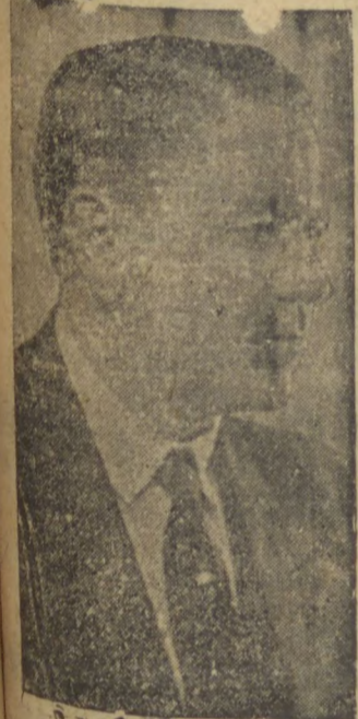
INTERVENTOR MANOEL RIBAS

Terá effectivação hoje a grande homenagem popular