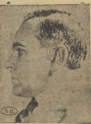
PRESIDENTE GETULIO VARGAS

Recebemos, encaminhado pelo "Serviço de Divulgação" do Gabinete do Chefe de Polícia Civil do Rio de