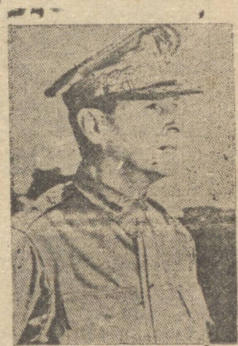
GENERAL MAC ARTHUR