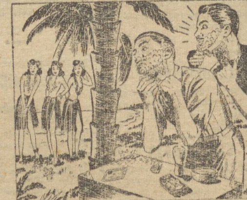
— Espia, rapaz! Estamos salvos! E se não, é miragem, estou vendo naquela praia algumas pessoas