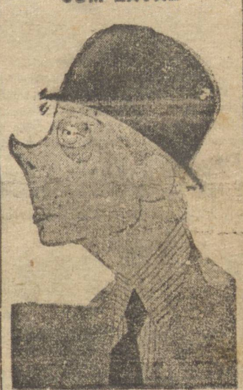
DUQUE DE WINDSOR

NOVA YORK, 4 (U.P.) — Faltado à imprensa o duque de Windsor afirmou que ao contrário do que foi noticiado, não mantinha relações de importância com Laval, com quem apenas travou conhecimento certa vez, na embaixada britânica de Paris.