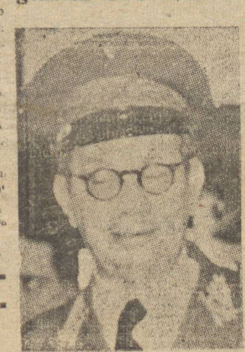
GENERAL GOIS MONTEIRO