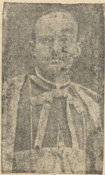
D. ANTONIO MAZAROTTO, Bispo de Ponta Grossa

No Brasil não temos partidos católicos; o que temos são partidos de católicos e dos que com eles quiserem colaborar, os quais incluem em seus programas as reivindicações da Igreja: Entre eles está o Partido