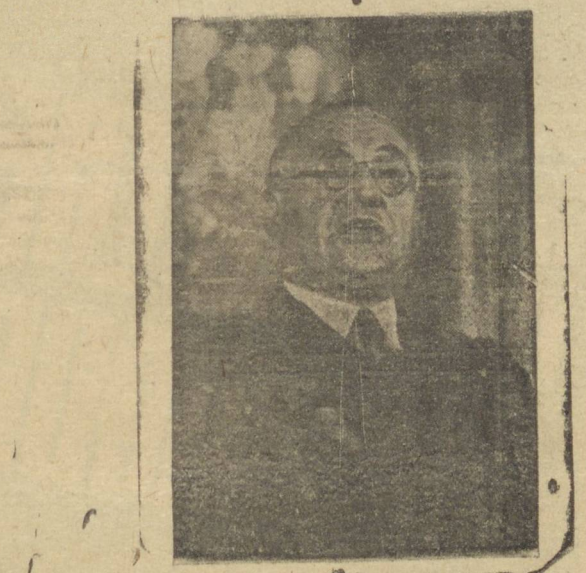
Ernest Bevin, líder trabalhista inglês