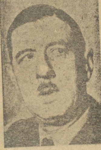
General De Gaulle

pressou que isso não exclua a consideração sobre muitos problemas que De Gaulle aparentemente deseja tratar. Eles abrangem, segundo se diz, desde o tratado que se deve dar à Alemanha até a devolução da Índia China.