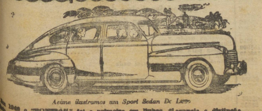
Acima ilustramos um Sport Sedan De Liss