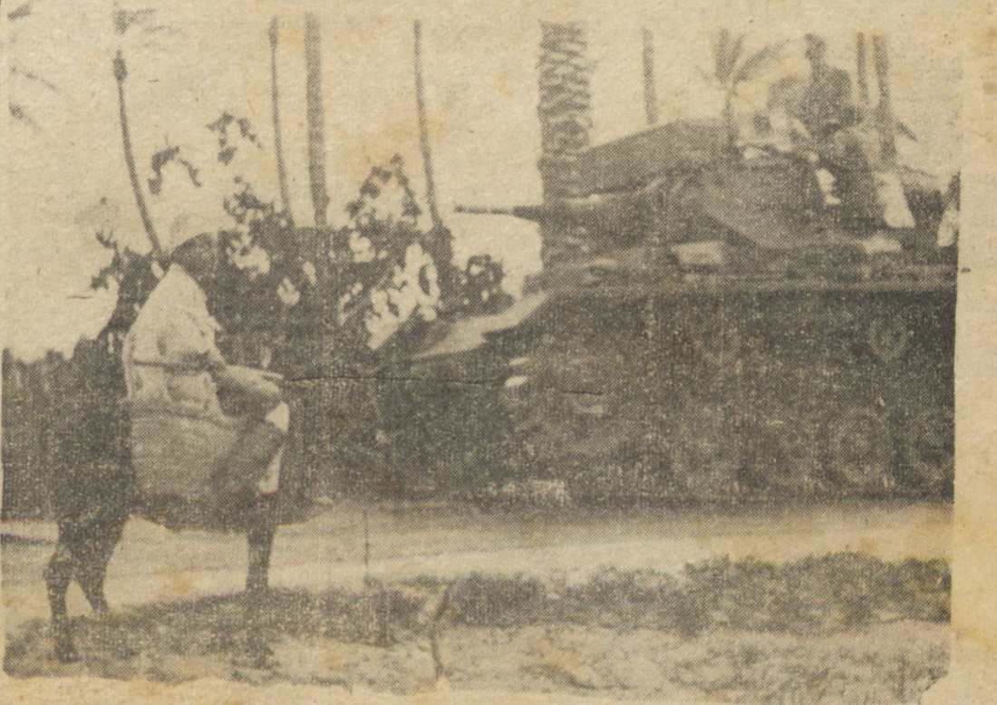
A BATALHA NA AFRICA — Duas éras encontram-se no deserto da Libia...