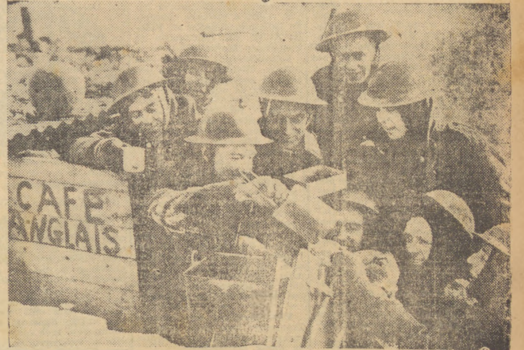
O ESPIRITO FRANCEZ — A guerra, até para aqueles que estão metidos nela e junto ás linhas de frente, tem seus momentos alegres. Assim, esses soldados, membros da guarnição de uma bateria anti-aerea, de serviço em "qualquer parte" da França, ao longo da Linha Maginot, reúnem-se felizes á entrada de seu "Café Inglês" afim de receber a ração de chá quente.