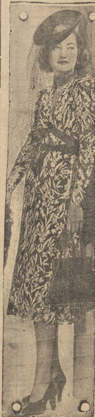
Este alegre vestido estampado, com vistosos motivos floreados, sobre fundo negro, de seda suave, é uma das prendas mais bonitas desta temporada.

Pondo em cima, no momento de reduzir, pedrinhas de estanho, este se une ao zinco formando uma boa solda com o aluminio.