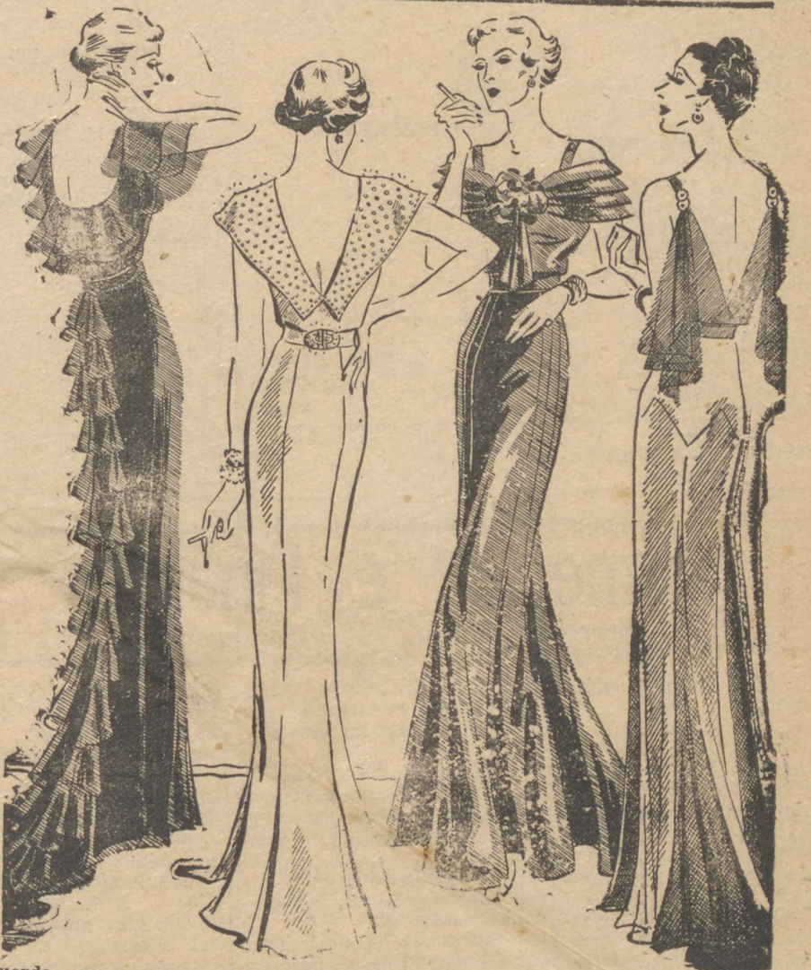
A' esquerda, vemos um vestido de "chiffon", com abas na espada e nos ombros e decotes. O vestido da esquerda, ao centro, é de crepe branco.

Rua Cel. Dulcideo n. 86, proximo á Officina Ford. Fone: 4-5-8.