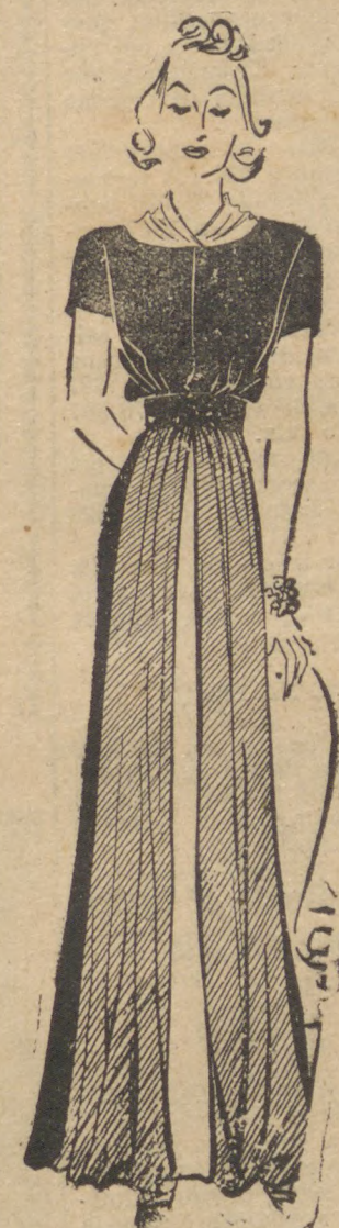
Jm modelo simples, mas nem por isso menos encantador.

Estes cuidados, métodos, receitas de cremes, tratamentos internos são indicados no meu livro "Estética", que acabo de lançar.