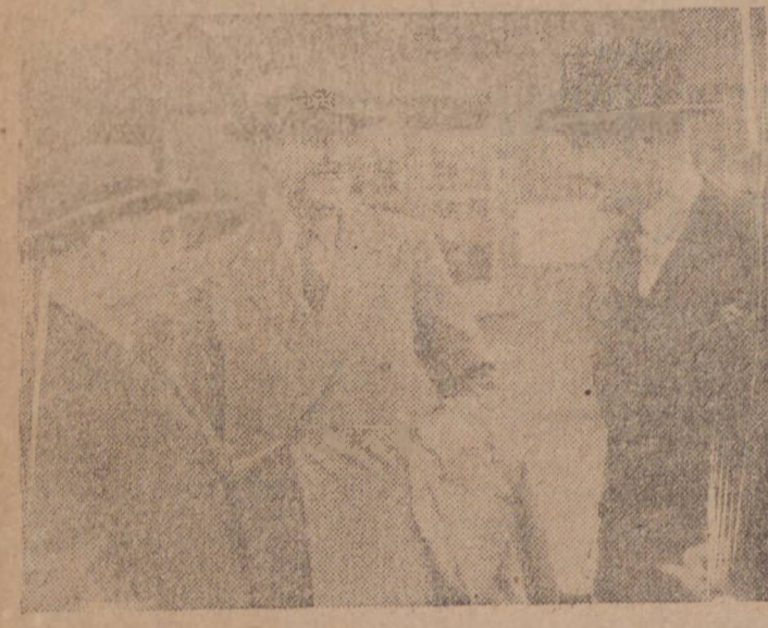
O MINISTRO DO EXTERIOR DA INGLATERRA, SR. ANTHONY EDEN, AO CHEGAR NO LOCAL DA CONFERÊNCIA DO PARTIDO CONSERVADOR, PARA PRONUNCIAR O SEU DISCURSO.

“Pego ao doutor Goebbels que tome a seguinte nota:” — terminou o ministro Anthony Eden.