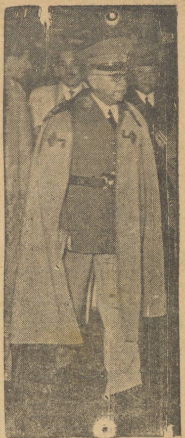
General Gois Monteiro