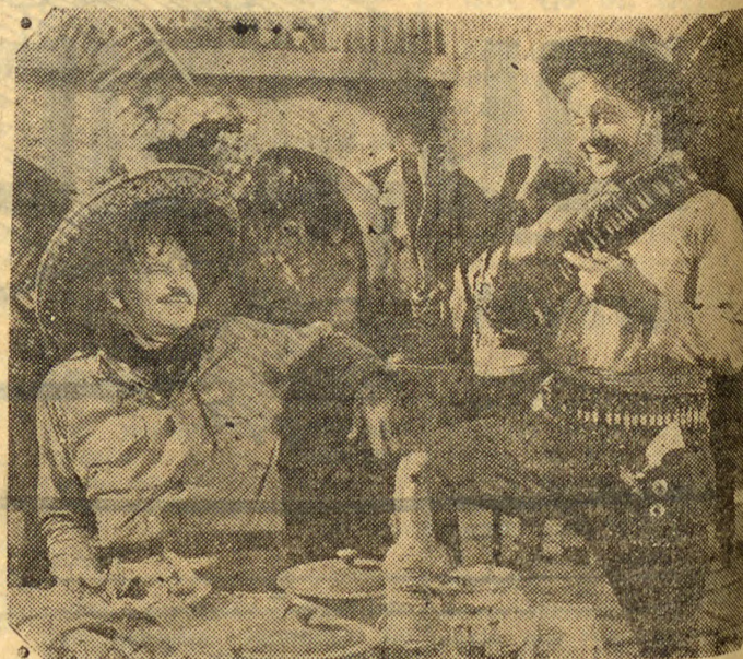
VVALLECE BERY EM: ..

12 atos formidaveis! "VILA VILA"! o unico filme que veiu de avião para o Brasil.