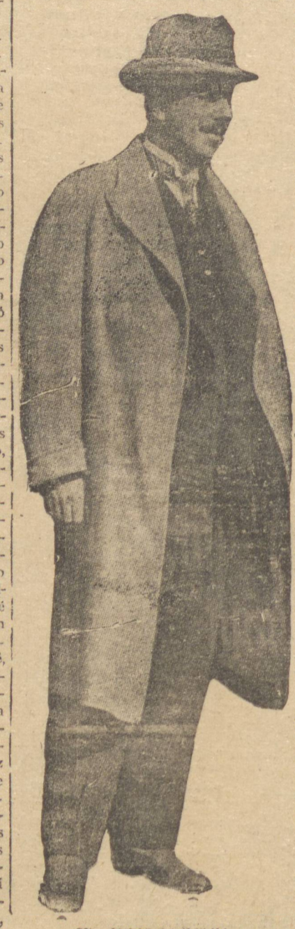
SR. JULIO PRESTES

RIO, 14 (D.) — Escreve "A Noite": Os próceres da U. D. N. andam em colírios. Tudo fizeram baldadamente para convertê-la num partido em que se arregimentassem todas as oposições coligadas. A atitude de algumas dessas correntes, irredutíveis no propósito de se manterem autônomas, embora apoiando a candidatura do brigadeiro, vem criando tantas e tais dificuldades, que até hoje a União Democrática só tem podido ter existência na demagogia dos "salvadores". Agravou-se a crise com a formação do Partido Nacional, congregando remanescentes dos velhos P. R. de São Paulo, Minas e outros Estados. A "doente" piorou e foi chamado para socorrê-la o sr. Julio Prestes. Preparou-se uma recepção festiva para o ex-futuro presidente da República, anunciando-se até mesmo que teria um grande banquete. Estavam as coisas nesse pé, acalentando-se um pouco de esperança, quando, de repente, chega a notícia de que ele desistira da viagem, preferindo ficar em paz com os seus amigos e correligionários perrepietas. E agora? Reunem-se às pressas os maiores udenistas, os srs. José Américo, Otávio Mangabeira, Jurael Magalhães, Prado Kelly, José Augusto, etc.,