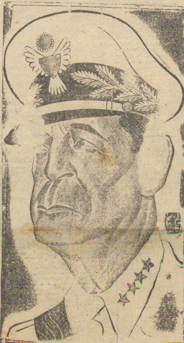
GAL. MAC ARTHUR, que ditará os termos da rendição do Japão

WASHINGTON, 14 (U.P.) — O norte e o sul, o leste e o oeste dos Estados Unidos celebram a vitória desde que ouviram a nota da agência "Domei" transmitida às 10,49 horas, hora da guerra no Pacífico, sobre a rendição japonesa. Populares fizeram fogueiras nas