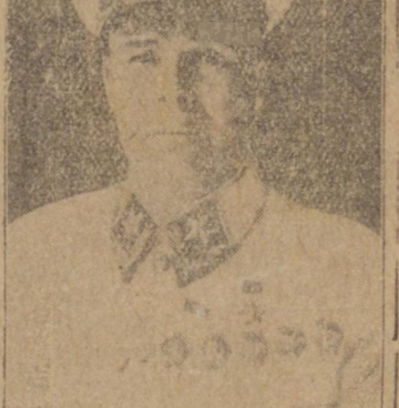
O Marechal Simeon Timoshenko, o bravo chefe russo, que comanda a maior ofensiva de todos os tempos.

ram a ocupação da ferrovia Moscou-Veliki-Luki, ao desalojar o inimigo de Olenino-Chertoline, últimos pontos dessa linha que estavam em poder dos nazistas. As pontas de lança moscovitas progrediram consideravelmente e suas forças ocuparam uma cidade e 10 aldeias, além de outras 42 povoações. Também foi anunciado que uma unidade estava avançando 9 a 10 quilômetros sobre a linha da frente, no prazo de 24 horas! MOSCOW, 6 (U.P.) — O trecho da via ferrea Veliki-Luki-Rzhev-Moscou, atualmente em mãos dos russos, corre paralelamente sobre o flanco norte da saliente germanica, saliente essa que pela vez chegou a ameaçar a capital da Rússia. Os últimos 72 horas. Ontem os russos completaram a recuperação dessa estrada de ferro sera bastante