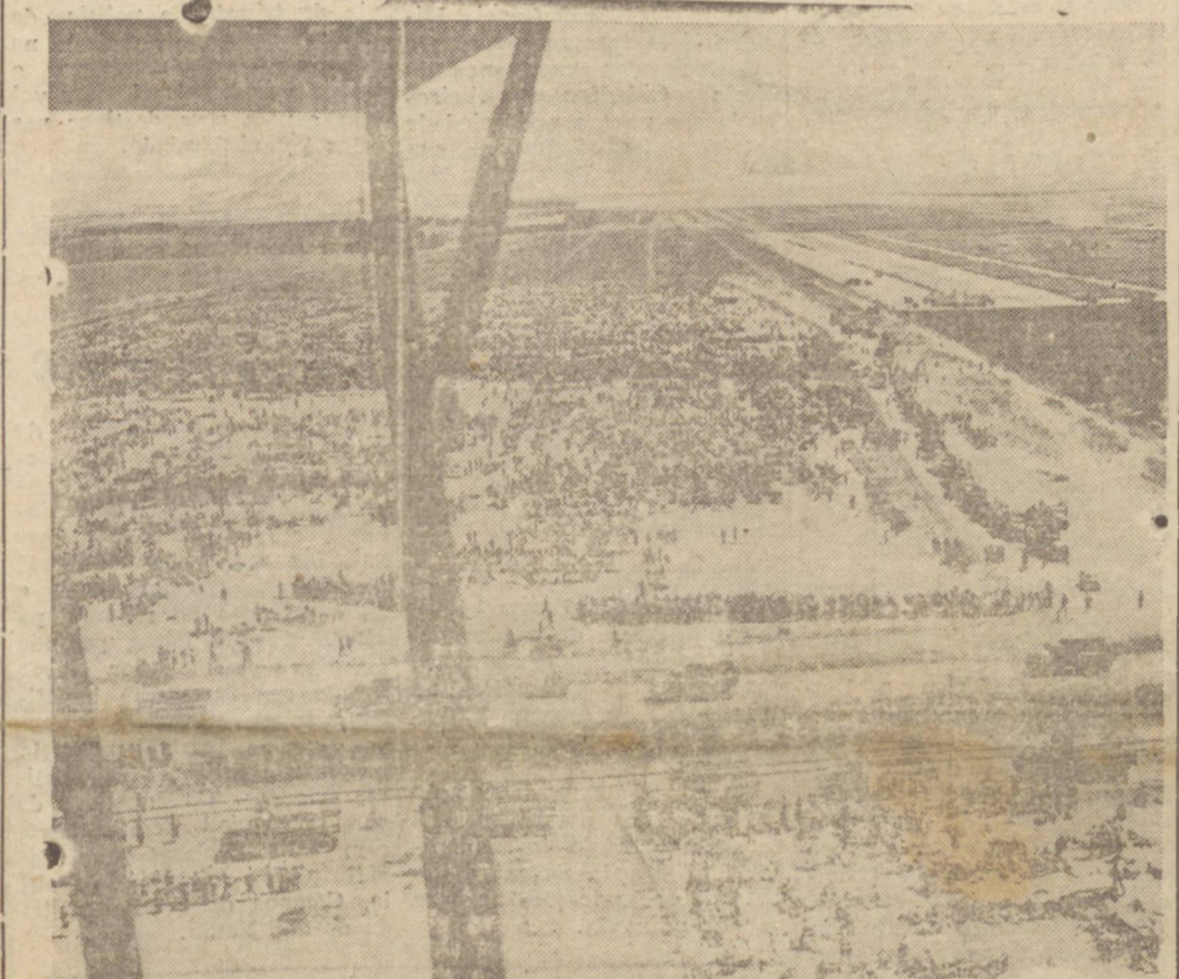
PRISIONEIROS DE GUERRA — Vista aérea de um acampamento de prisioneiros alemães e italianos, capturados pelas forças aliadas durante a campanha da Sicilia. Estes prisioneiros estão atualmente em território da Africa do Norte. (Foto Inter-Americana).

figuram o conhecido jornalista Roy W. Ward e sua esposa, bem como o famoso escritor chinês Lin-Yutang. FILADELPHIA, 7 (terça-feira U. P. - Urgente) — Colômbia se de 150 e 200 o numero de mortos em consequência do descarrilamento de trem de passageiros entre Washington e Nova York.