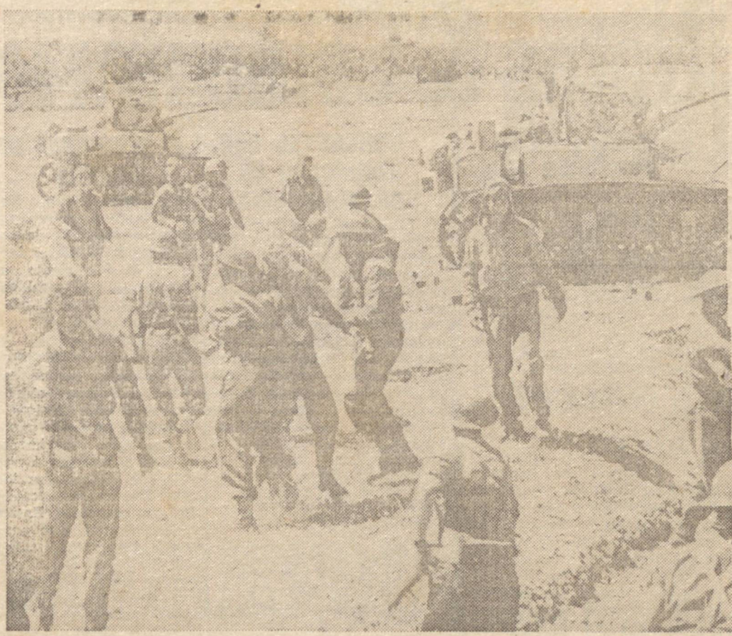
ENCONTRO FRATERNAL — As tropas norte-americanas confraternizam com as forças do Oitavo Exército, quando o antes da derrota do "eixo" naquela ilha.