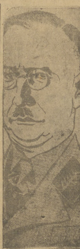
HIMLER, CHEFE DA GESTAPO, POLICIA POLITICA ALEMA

Até aqui nada se alterou em comparação áquela época, com exceção de um fato importante, e este é que o governo germanico de hoje controla o paiz ao passo que o de 1914 era extremamente fraco. Para os membros do nosso governo os soldados britânicos, no campo de batalha, são perfeitamente iguais a quaisquer outros, e o