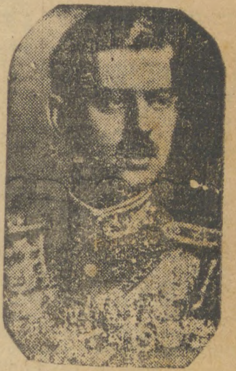
O REI CAROL