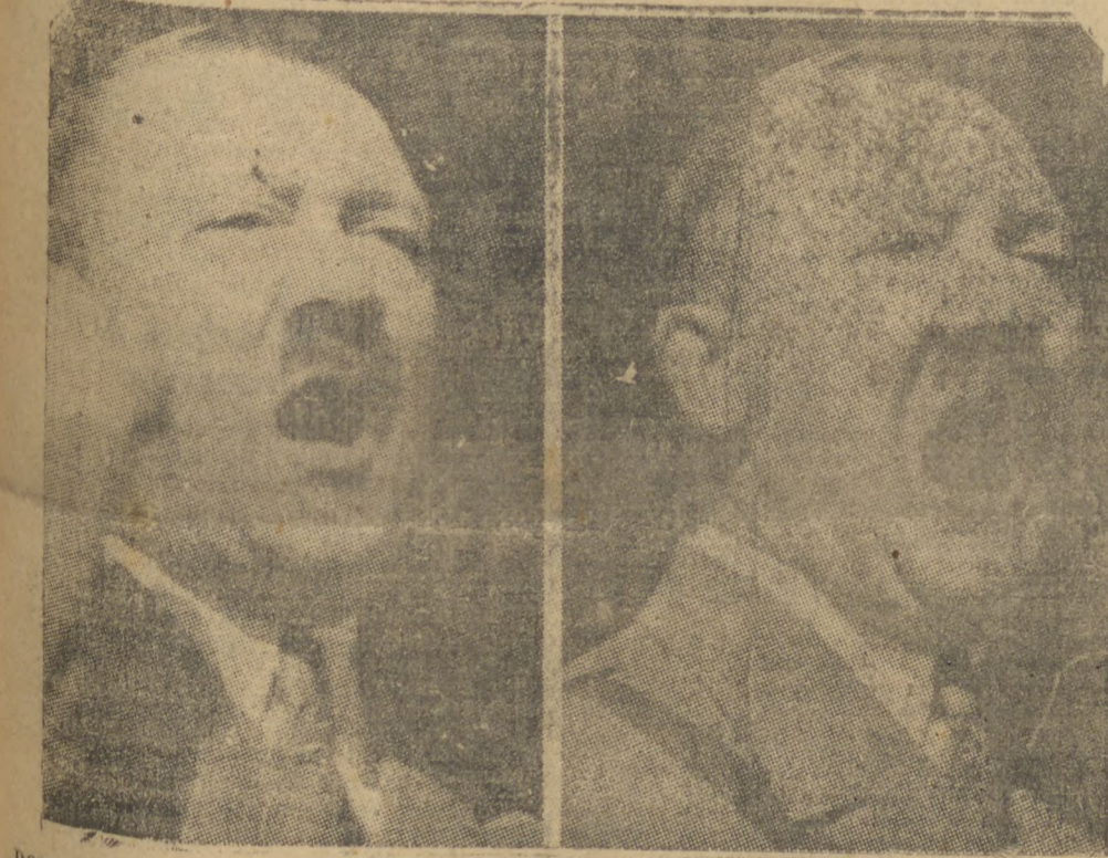
DOIS FLAGRANTES DO "FUEHRER" TOMADOS NUM DE SEUS ULTIMOS DISCURSOS

ABERTO RIGOROSISSIMO INQUERITO — O DISCURSO DE HITLER