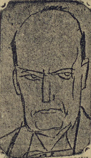
SR. BENITO MUSSOLINI

NAPOLES, 20 (D) — A partida do navio que leva para Masaouba, na Erythrea, dois batalhões da milicia fa-