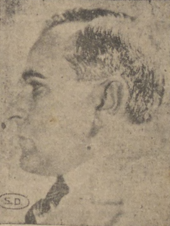
Sr. Getulio Vargas