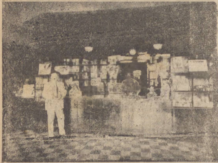
FARMACIA MILKA, LOJA

UM EMPORIO COMERCIAL QUE HONRA A PONTA GROSSA. — O SEU MODERNO LABORATORIO E OS SEUS VARIOS E OTIMOS PRODUTOS.