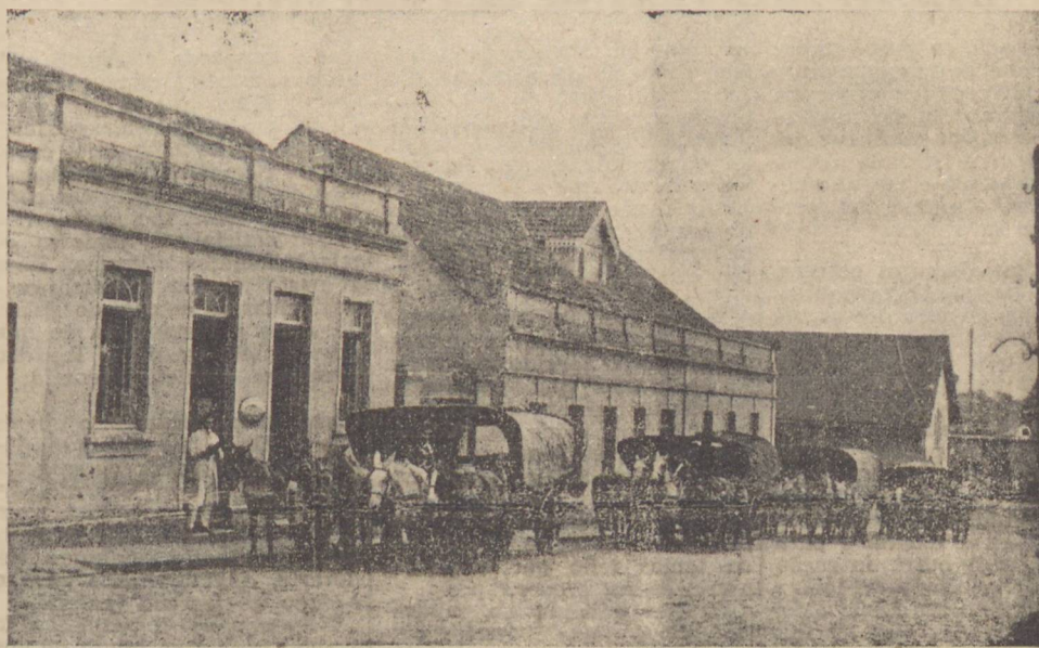
A ERVATEIRA PONTAGROSSENSE