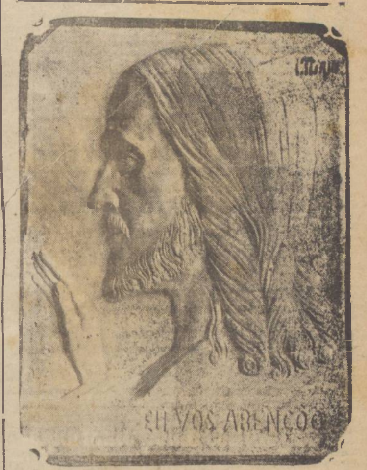
EU VOS ABENÇOO — DISSE O MEIGO NAZARENO... E contemplando, agora, o panorama do mundo dirá: — E eu disse — Amai-vos uns aos outros...