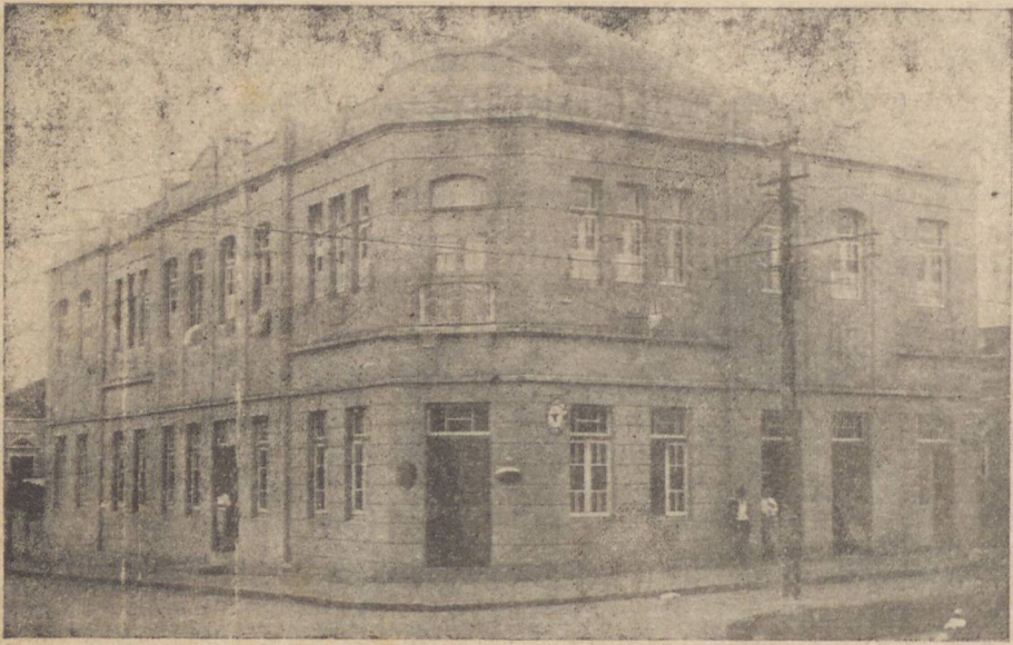
A Sede da firma, em edificio proprio

e a sua invejável situação no comercio e na industria pontagrossenses