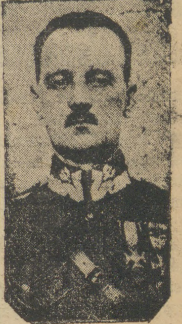
General de divisao Wladyslaw Sikorski, comandante em chefe do exercito polonês na França

Dentro deste novo Estado será constituída uma provincia exclusivamente israelita com uma população de 3 milhões de habitantes judeus. A capital desta provincia será Lublin. COPENHAGUE, 20 (D.) — O correspondente berlinense do jornal "Politiken" comunica que os alemães estão formando uma zona perto de Varsovia, onde serão localizados os poloneses que antigamente habitaram no oeste do país, ao passo que a zona de Lublin será reservada para os judeus. Os distritos evacuados pelos poloneses serão destinados aos evacuados germanicos dos Estados balticos.