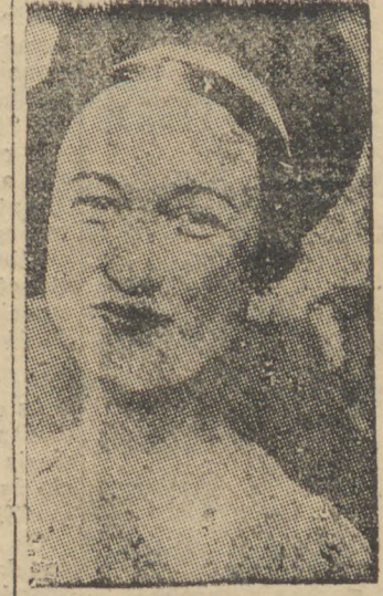
O Duque e a Duquesa de Kent