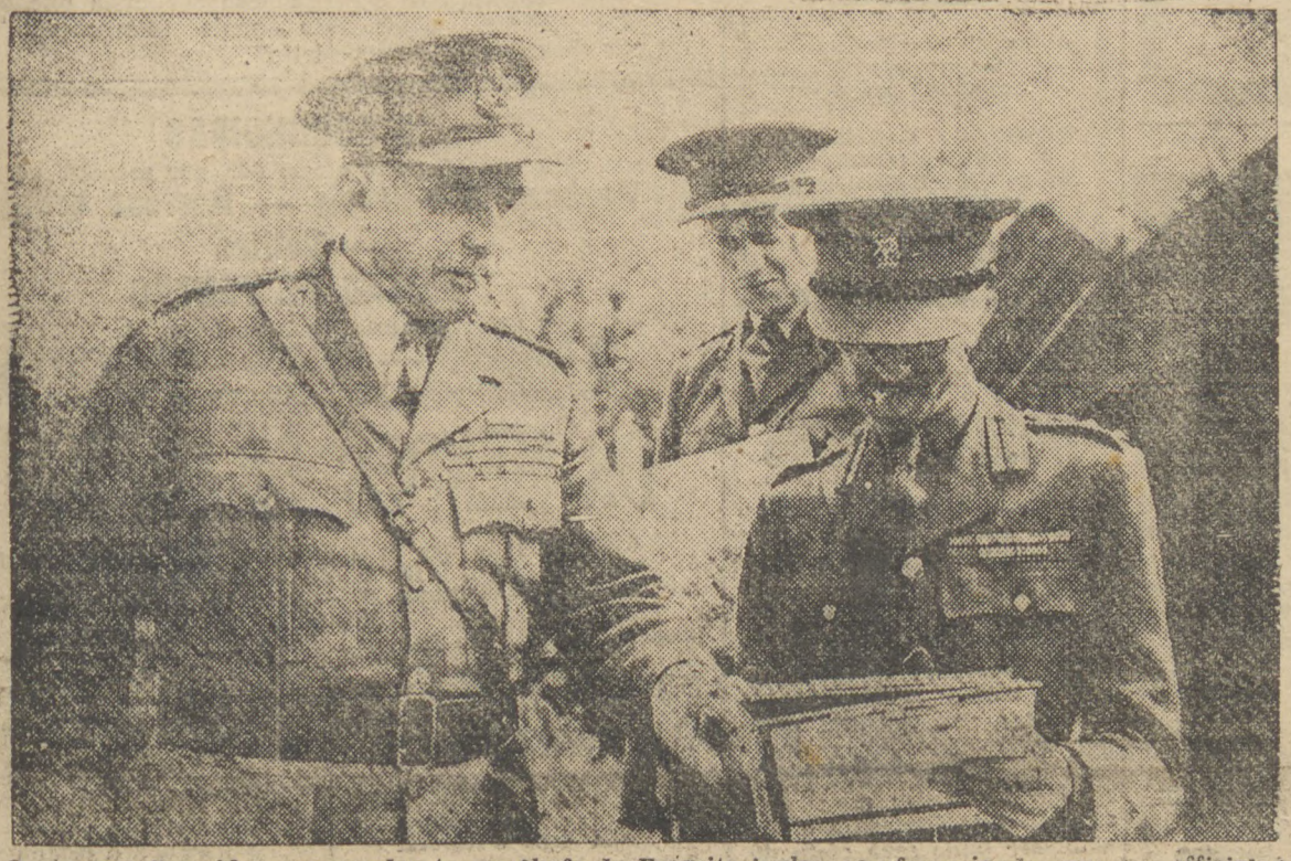
O general Ironside, commandante em chefe do Exército inglês, conferenciando com um official do Estado-Maior

OS INGLESES QUE ESTÃO NO FRONT — ESTRASBURGO PARECE MERGULHADA EM PROFUNDO SONO — RELATORIO DE VIAJANTES NEUTROS — LAMA NA TERRA DE NINGUEM