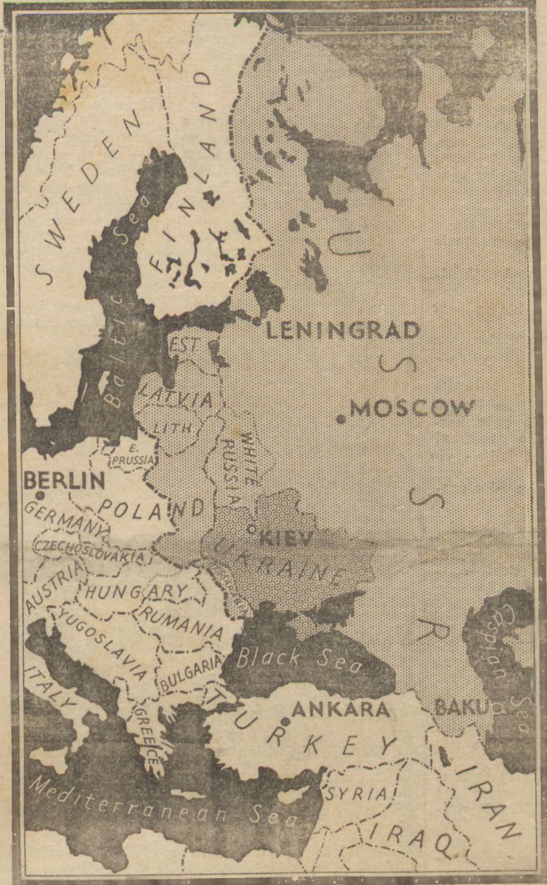
A FRENTE DE MOSCOU

Os soldados vermelhos lutam desesperadamente para impedir a queda final!