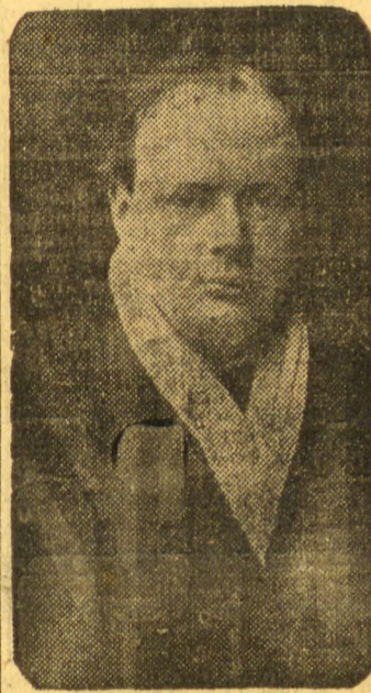
Sir Winston Churchill

LONDRES, 27 (S. P., agência norte americana) — Falando hoje na Câmara dos Comuns, o sr. Winston Churchill, Primeiro Lord do Almirantado, afirmou que a marinha de guerra da Grã Bretanha havia encontrado o meio de neutralizar o perigo das minas magnéticas e as de outras variedades. Informou ainda o sr. Chur-