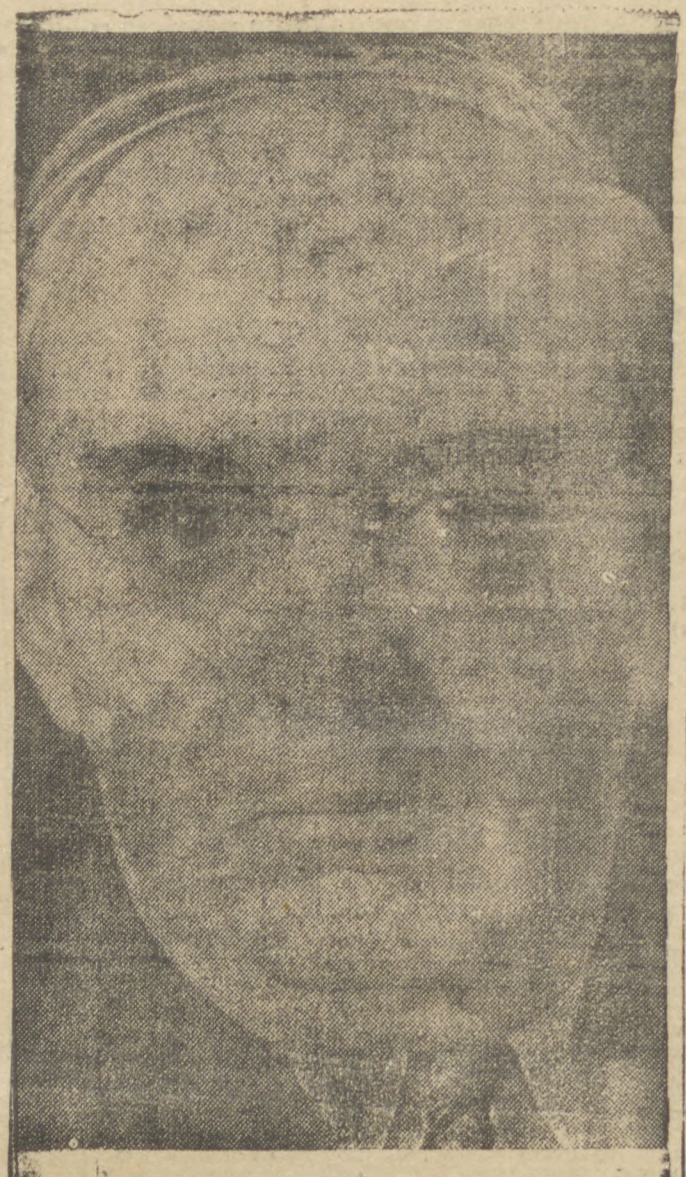
Senador Arthur Hendrick Vandenberg que prometeu voto favoravel ao Governo

WASHINGTON, 7 (D.) — O presidente Roosevelt e os circulos politicos norte-americanos continuam a conservar estrito silencio a respeito da atitude que os Estados Unidos tomarão em consequencia do discurso do chanceler do Reich. Isto demonstra a aversão crescente do povo norte-americano a possibilidade de ficar envolvido na guerra europeia. O parecer individual de varios senadores confirmam esta tendencia. Os senadores Copper, George Morris e Gerald Nge declararam que o bloco de neutralidade deve ser fortalecido em consequencia do discurso do sr. Hitler. O senador Pittman, presidente do comitê das relações exteriores, abordando a questão já algumas vezes ventilada, de que o presidente Roosevelt fará o papel de mediador, afirmou que sob certas circunstancias o presidente estará pronto para, em qualquer data, tomar tal atitude.