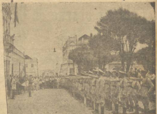
solenidade do juramento á Bandeira da turma de um dos anos passados

Realiza-se hoje, no Quartel do 13.º R. L., a significativa solenidade do Juramento á Bandeira, dos novos reservistas de 1943.