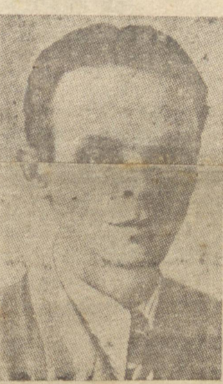
SNR. APOLONIO SALES