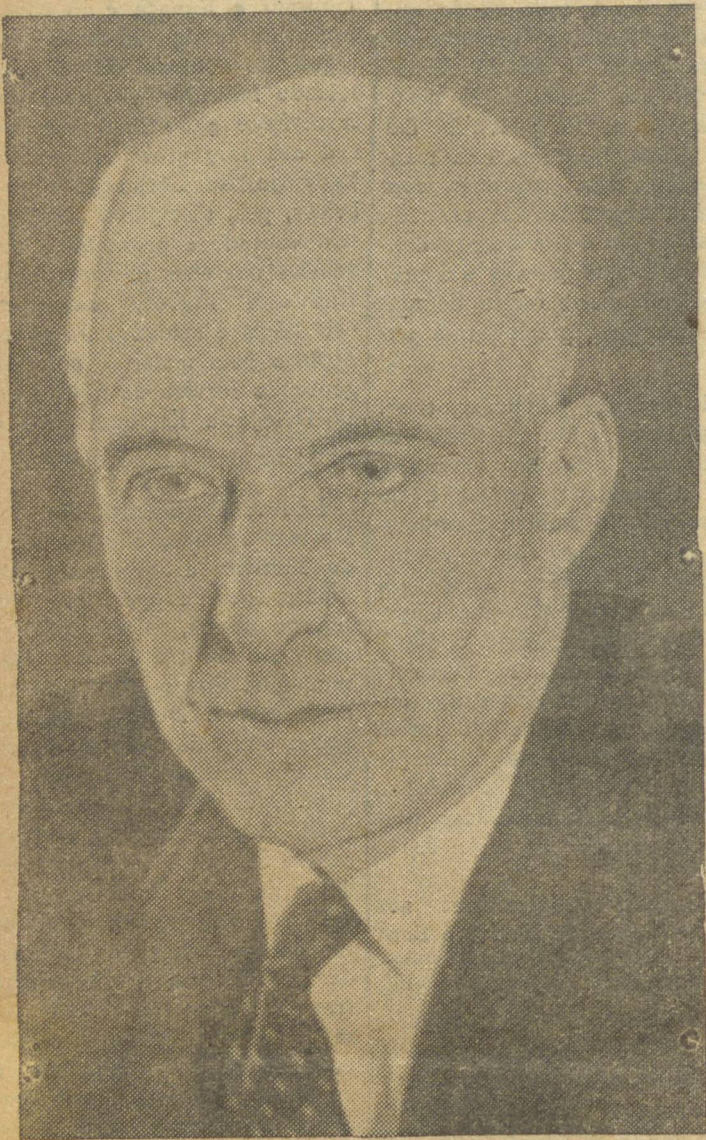
ALMIRANTE LORD LOUISMOUNTBATTEN, Supremo Comandante Aliado no sudoeste da Asia (BNS).

E' o que acaba de acontecer. Segundo nos informou uma comissão de comerciantes que esteve em nossa redação, o referido memorial, solicitando seja decretada a observação da "semana inglesa", com o fechamento do comércio ás 12 horas de sábado, foi enviado ao snr. Prefeito Municipal, com 250 assinaturas de comerciantes. O numero de assinaturas traduz, como é evidente, o desejo da maioria e assim não haverá dificuldades ao governante da cidade para atender o que lhe é solicitado. Podemos ter por certo, pois, que dentro em breve nosso comércio estará observando a "Semana Inglesa", sem prejuizo para os estabelecimentos em geral, nem para o público e concedendo, á sacrificada classe dos comerciantes mais algumas horas de justo repouso.