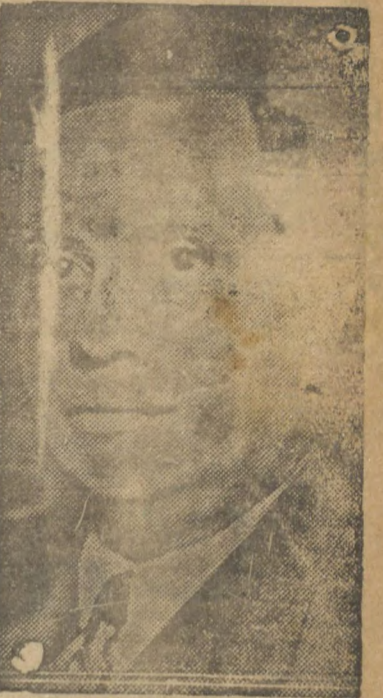
O "DIÁRIO DOS CAMPOS" apresenta, em nome da população pontagrossense, os votos de boas vindas ao eminente militar.