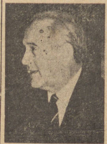
Ministro Oswaldo Aranha

S. PAULO, 23 (A. N.) — O ministro Oswaldo Aranha, brevemente aqui, concedeu uma entrevista à imprensa.