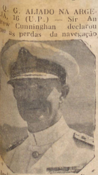
Almirante Sir Andrew Cunningham, comandante em chefe da esquadra britânica no Mediterraneo.

Interessantes declarações do almirante Sir Andrew Cunningham sobre os "combates"!