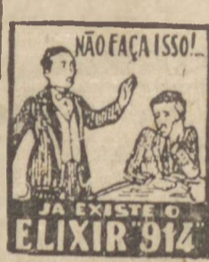
JA EXISTE O ELIXIR 914

INOFENSIVO AO ORGANISMO, AGRAVAVEL COMO LICOR