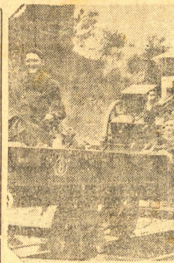
Flagrante da partida de Bruxelas tropas para reforçar as

LONDRES, 15 (U. P., agência norte americana) — O jornal "Daily Sketch" afirma que enquanto o rei Carol discute com seus conselheiros sobre a possibilidade de ser realizado um plebiscito na região de Dobrudja, reivindicada pela Bulgária, Hitler prepara-se ativamente para fazer passar pela Eslováquia as tropas alemãs na fronteira da Hungria com a intenção de invadir a Rumania.