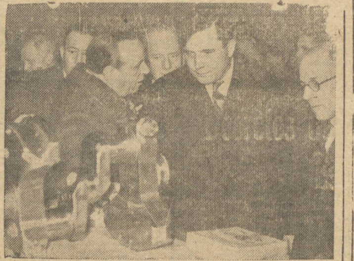
WENDELL WILLKIE, FALANDO AOS JORNALISTAS

Muitos há que veem nos DEIPS apenas finalidade jornalística atual, de publicidade e divulgação de fatos e coisas do momento. Nisso, porém, vai unilateralidade de vistas, porquanto, os DEIPS têm ação muito mais profunda, como órgão oficial de cada Estado, no mister divulgador do ambiente histórico, social e econômico, no tendo representar papel de verdadeiro incentivador das obras culturais, artísticas e