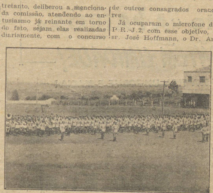
GLORIOSO 13.º R. I. PRONTÓ PARA MARCHAR

Os dois conterrâneos, após haverem cursado o Aero Clube Pontagrossense, fizeram, no grande país amigo, estágio de aperfeiçoamento, depois do que deveriam ocupar o posto de combate que lhes fosse designado. Jovens arduos, sabendo a sua Pátria em luta, não aguardaram aqui o desentrelar da guerra a que foram levados pelo atilado traçoiro dos hunos de Hitler. Profundicaram-se a ir. aos Estados Unidos para se submeterem ás duras provas que o soldado do ar deve suportar. E lá estavam, empenha-