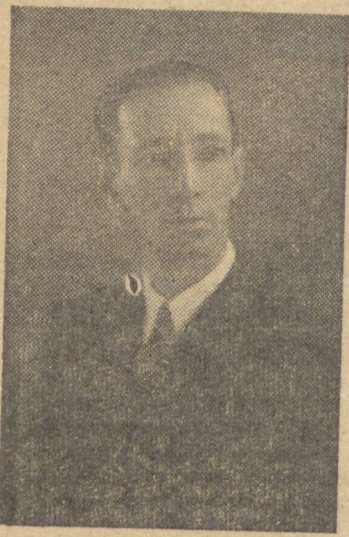
Cap. Fernando Flores

CURITIBA, 4 (Pelo telefone) — Em avião da Vasp., viajou ante-onde do Rio para S. Paulo, o capitão Fernando Flores, Secretário do Interior, Justiça e Segurança do Paraná. S. excia. em data de hoje, participará da solenidade da entrega da bandeira nacional ao Corpo Expedicionário, cuja solenidade terá lugar na capital paulista.