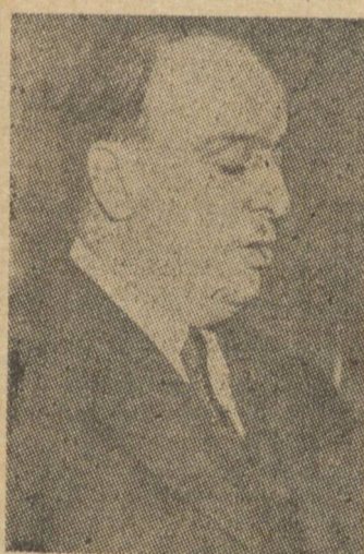
Ministro Souza Costa

Dois outros ministros irão também à capital gaucha