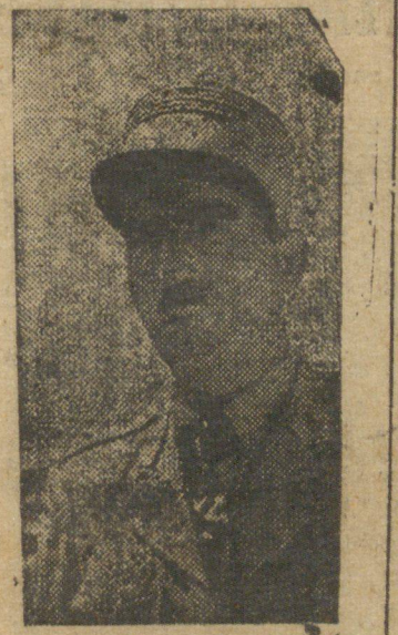
GENERAL DE GAULLE

Como ministro da Guerra do regime de Farrell se encontra o cel. Juan Peron, chefe do grupo de oficiais unidos. Seus poderes foram disputados pelas forças militares e navais, quarta-feira, quando foi feita entrega do ultimatum exigindo que ele passasse o poder ao presidente do Supremo Tribunal ou reconduzisse Ramirez ao governo, porém a revolta fracassou.