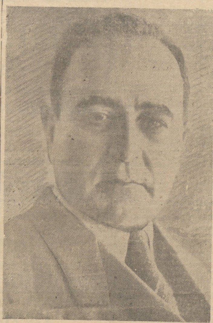
PRESIDENTE GETULIO VARGAS

Continuam em vigor todas as determinações anteriores.