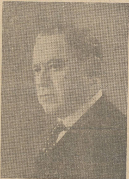
INTERVENTOR MANOEL RIBAS

Festividades, não simplesmente promovidas, como era costume em décadas pretéritas, por mero espírito de obediência e interesse subalterno, mas nascidas dum grande senso de brasilidade, tendo um sentido profundo de gratidão — citemos bem — efetivar-se-ão na data transcorrente, pelas reuniões do Estado. São comemorações que não visam puramente não deixar passar despercebida uma data, como aconteceria ou aconteceria em efemérides de fundo e limite familiares. São homenagens dirigidas a uma personalidade e a um estadista que se tornou o maior e o mais legítimo patricio da evolução do Paraná. Jamais devemos nós outros tantos e tão assinalados serviços a um chefe de Estado, no Brasil, como ao sr. Getulio Vargas. Sem medo de engano, pôde-se afirmar que não existe um problema sequer no Paraná cuja solução não tenha em relevo, a marca indelével do seu nome.