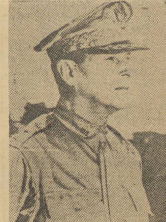
GENERAL MAC ARTHUR

Todos os contra ataques alemães na area do 5.º Exército na Italia, foram rechaçados e acrescenta o mesmo comunicado.