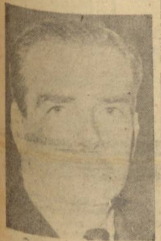
MINISTRO ANTHONY EDEN

"É absolutamente essencial que exista entre nós o mecanismo especial — ação de intercâmbio — a que se medi-