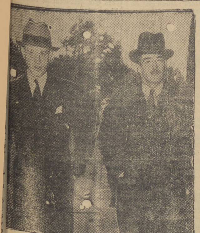
No momento em que as democracias da Europa attingem o maximo de seus esforços no sentido de estreitar a solidariedade entre as nações livres dentro de um ambiente de alta confusão, para que se fortaleça o bloco democratico...

Após a cerimonia, o Duque pronunciou um breve discurso, o qual concluiu dizendo que a Italia provará a força de suas decisões, quando chegar a hora.