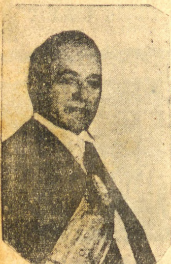
Presidente Getúlio Vargas

S. PAULO, 6 (A. U., Brasil) — Consciente havia sido prestabeleido, o avião conduzindo o Presidente Getúlio Vargas e sua comitiva, levantou voo pela manhã com destino a Campo Largo, onde chegou ás 10 horas. Daquela cidade, s. exa. seguiu de automovel para Ipanema, onde visitou e inaugurou a primeira usina de fosfato de calcio, donde se ex-