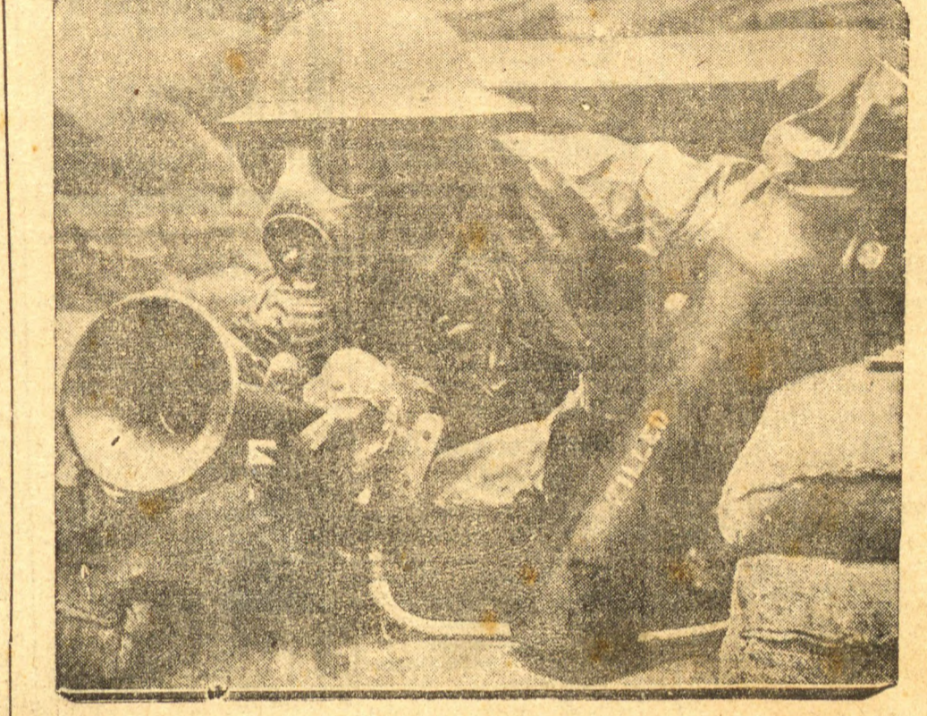
VISAO DO "FRONT" — Um soldado britânico em seu posto "num ponto" da linha de frente. Está munido de mase ara contra gaz e pronto para fazer funcionar seu aparato para lançar chamas em qualquer emergencia.

Suspensas as licenças aos operarios das linhas de fortificações