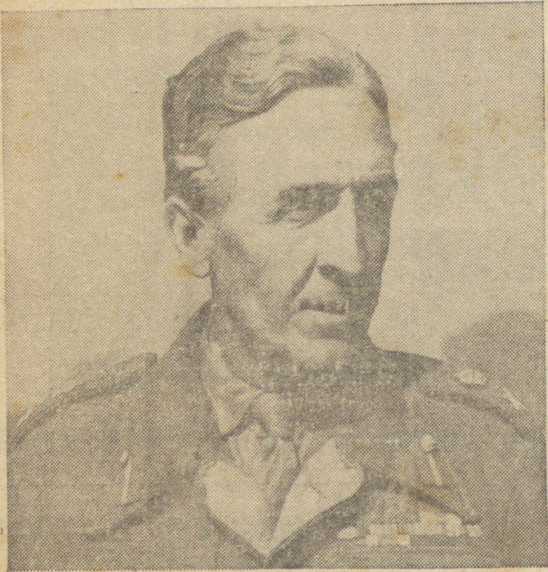
Fotografia do general Horrocks, na França.

vista ao vespertino "A Notícia". Disse o presidente da Sociedade Amigos da América que se está fazendo muita confusão e dando interpretações variadas ao referido documento. O general Manoel Rabelo informou que daquele seu encontro com Prestes não trouxe a impressão de que ele pretendia enfileirar-se aos partidários do governo, se bem que seja contrário inteiramente a qualquer perturbação da ordem pública.