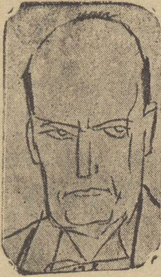
— O "Duce" —

O prestigio de Mussolini empallideceu dado a incapaci-