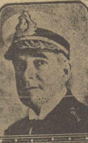
Almte. Protogenes Guimarães

Para a Marinha houve aumento de despesa no orçamento de 1935. Desse aumento, 230 mil contos serão reservados para a execução de plano de renovação da frota. Esses projectos estão tecnicamente resolvidos e aprovados. Vamos trocar navios por mercadorias brasileiras, fóra da balança de exportação. O processo é simples como o ovo de Colombo. Mandaremos comprar contra torpedeiros na Inglaterra, submarinos na Itália e navios auxiliares e tanques na Italia e na Holanda. Numerosas firmas de países já apresentaram-se para a concorrência. Não está excluído dessas negociações. Entrarão nellas algodão, banha, assucar e mais alguns outros productos.