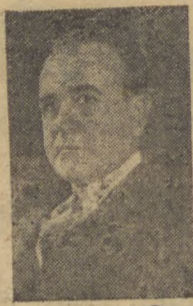
Sr. Getulio Vargas

O sr. Getulio Vargas prometteu assignar sabbado o decreto, perante uma comissao de universitarios que virá especialmente de Porto Alegre.