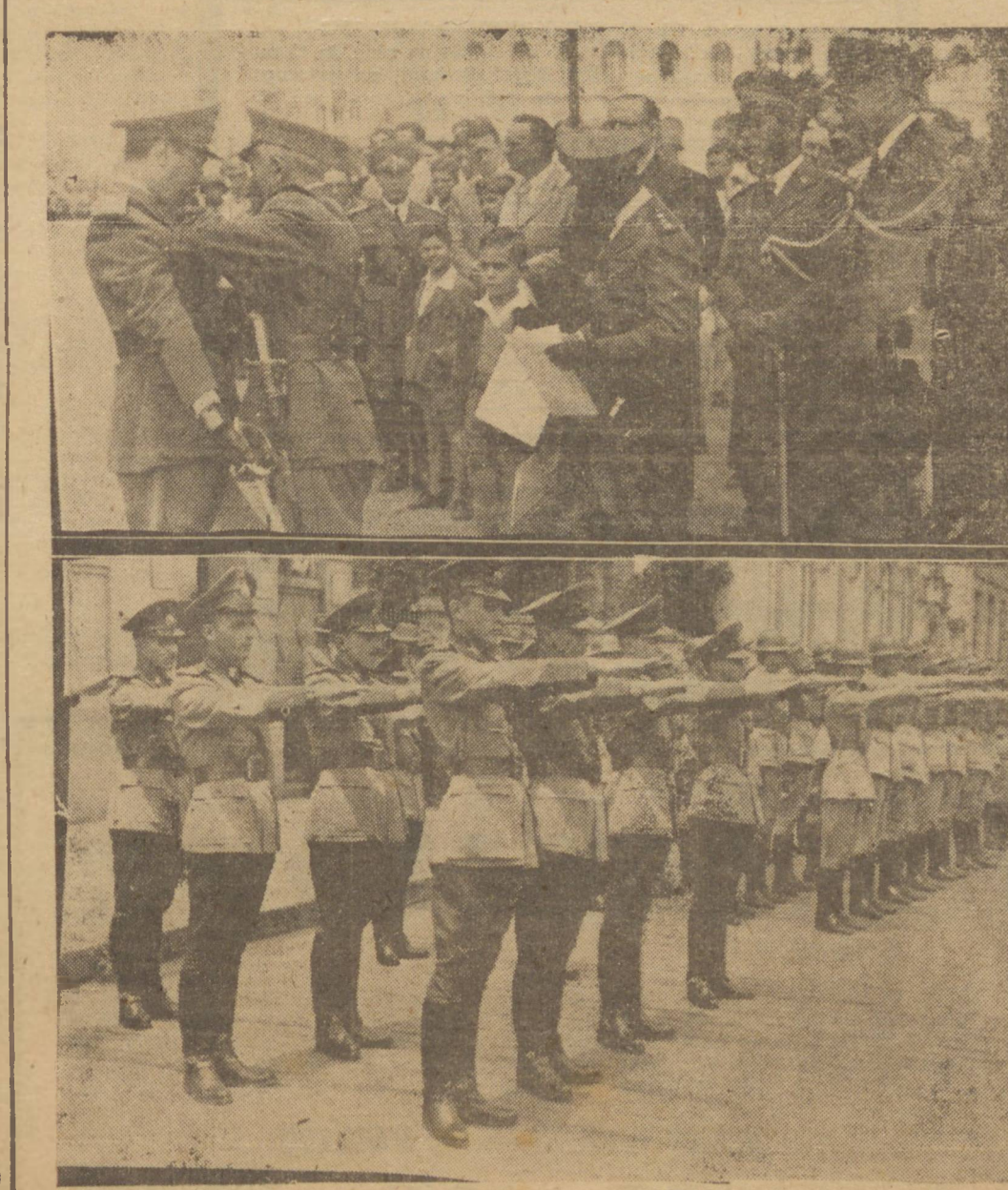
ASPECTOS FOTOGRAFICOS APANHADOS POR OCASIAO DA CONDECORAÇÃO DE OFICIAIS E DECLARAÇÃO DE ASPIRANTES A OFICIAIS DA RESERVA NA CAPITALL DO ESTADO