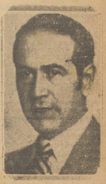
MINISTRO OSWALDO ARANHA

Declarada a adesão do governo e do povo do Brasil à declaração de Teheran