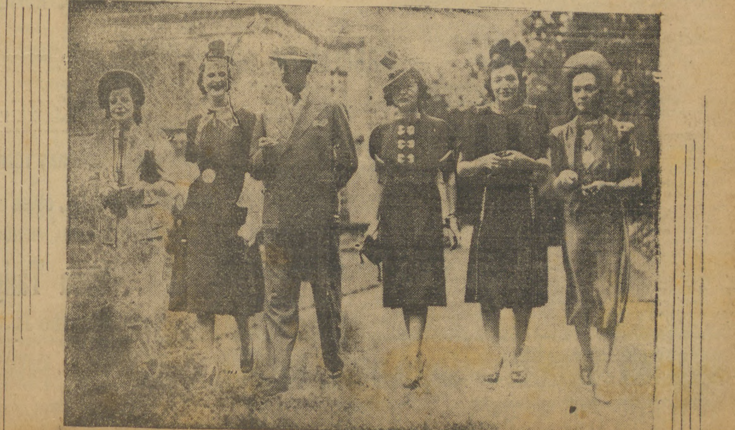
Não, amigo leitor, não arregale os olhos! Não se A fotografia vem de Ver-